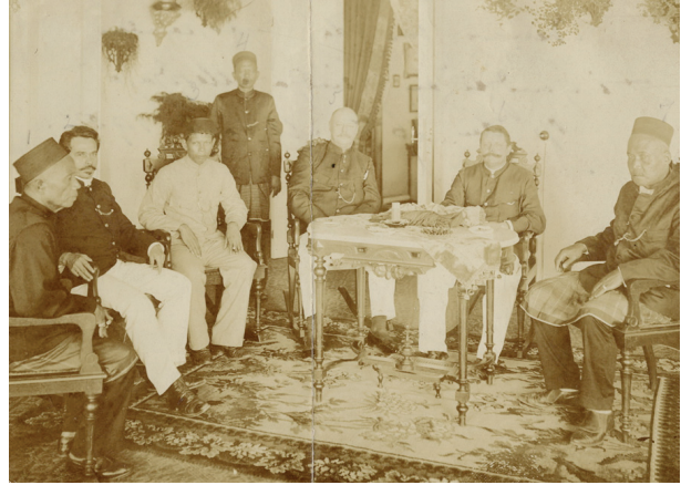
De overdracht van de regalia van de vorst van Jambi aan de Nederlandse autoriteiten, 26 maart 1904. O.L. Helfrich zit centraal achter de tafel.

werd erop afgestuurd en slaagde erin de familie van de Sultan te overreden de regalia af te staan aan de koloniale overheid. 16