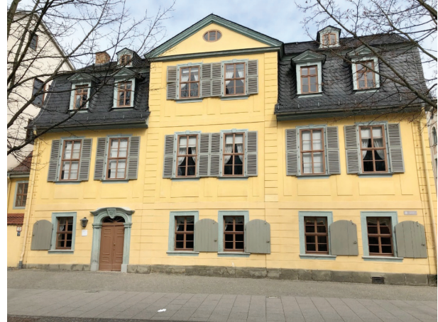
Het huis van Friedrich Schiller in Weimar.

toen al) hielden de Jena romantici op gepaste afstand. 1 De huizen van Goethe en Schiller staan er nog en zijn tegenwoordig te bezoeken. Voor mijn voorbeeld neem ik u mee naar het huis van Schiller.