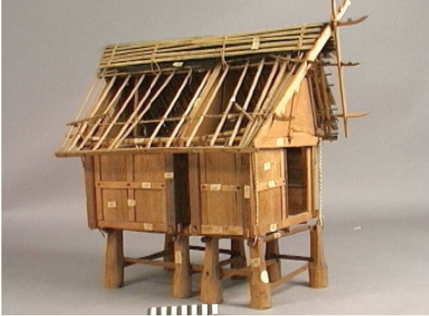
Een door Helfrich verzameld huismodel. Collectie NMVW 886-1.

onderscheidde hij maar liefst 119 onderdelen, alle voorzien van lokale naam. 15