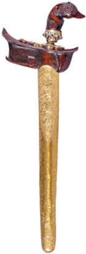
Kris Si Ginjai, Museum Nasional Indonesia. MNI 10921/E.263.

geladen politieke context. Vooral als het betreffende voorwerp in een depot wordt opgeborgen en niet openbaar toegankelijk is, neemt de invloed ervan af. Het wordt niet meer gezien en de documentatie wordt vergeten. Daardoor is vaak veel diepgravend onderzoek nodig om het voorwerp zijn betekenis, zijn kracht en invloed dus, weer terug te geven. Met onze verzamelpraktijken ontnemen wij dus niet alleen een eerdere eigenaar het fysieke voorwerp, maar ontdoen wij ook het voorwerp van zijn kracht, als het ware zijn functie in het leven. Dit brengt ons bij het laatste inhoudelijke gedeelte van deze oratie. De ethische aspecten van verzamelen.