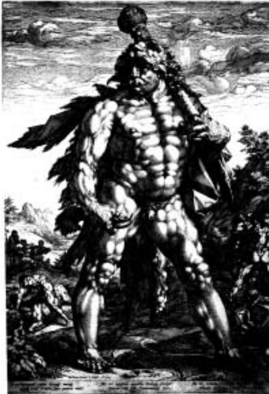
Hendrick Goltzius, De grote Hercules , gravure, 561 × 402 mm, 1589.

Met de reproductie van tekeningen van Bartholomeus Spranger in gravure propageerde hij de elegante, gemanieerde stijl van de Praagse hofschilder, die de Haarlemse kunst zou domineren tegen de eeuwwisseling. Tijdens een reis naar Italië leerde hij het werk