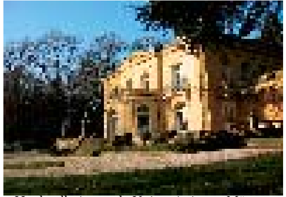
Het landhuis van de Universiteit van Münster