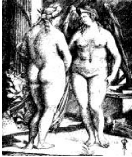
Jacopo de' Barbari, Overwinning en roem , gravure, 180 × 123 mm, circa

In de eerste zaal vallen de gravures van Jacopo de' Barbari en Girolamo Mocetto het meest op; rond 1500 gingen zij zich intensief bezighouden met de prentkunst. Kenmerkend in hun werk is de beïnvloeding door Noord- en Midden-Europese kunstenaars. De gravure Overwinning en roem van De' Barbari die pal naast De vier heksen van Dürer hangt,