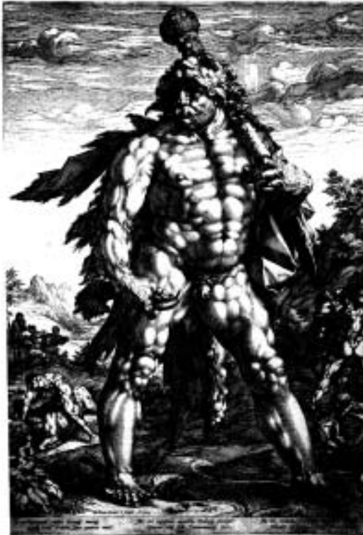
Hendrick Goltzius, De grote Hercules , gravure, 561 × 402 mm, 1589.

Met de reproductie van tekeningen van Bartholomeus Spranger in gravure propageerde hij de elegante, gemanieerde stijl van de Praagse hofschilder, die de Haarlemse kunst zou domineren tegen de eeuwwisseling. Tijdens een reis naar Italië leerde hij het werk