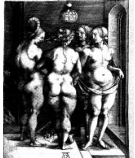
Albrecht Dürer, De vier heksen , gravure, 192 × 134 mm, 1497.

Onder invloed van het Maniërisme begonnen Venetiaanse kunstenaars, zoals Schiavone, vanaf de jaren dertig etsen en gravures te maken in een zwerige stijl met langgerekte en elegante figuren. In de vrije manier van etsen springt Schiavone's inventiviteit in het tekenen meer naar voren dan zijn beheersing van de grafische techniek. De 'disegni stampati' – gedrukte tekeningen – van Battista Franco laten daarentegen een virtuoos samengaan zien van inven-