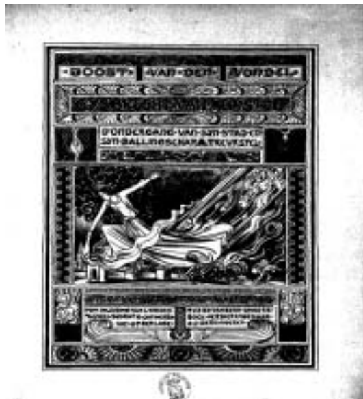
Titelpagina van 'DerKinderens Gysbreght '

November 2002 was een bijzondere maand. Het was de maand waarin ik afstudeerde en de van oorsprong Haarlemse uitgeverij Bohn 250 jaar bestond (7 november). Het toeval wil dat beide gebeurtenissen te maken hadden met een hele bijzondere uitgave van de Gysbregt van Aemstel , Joost van den Vondels (1587-1679) beroemde toneelstuk uit 1637 over de belegering en ondergang van Amsterdam. Het werk was al vele malen eerder uitgegeven, maar nu eens wilde men