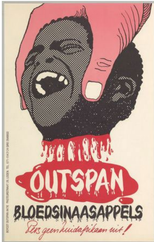
Ontwerper affiche: Rob van der Aa

De Boycot Outspan Aktie werd in 1970 opgericht en hield zich bezig met het bestrijden van het apartheidssysteem van Zuid-Afrika en van racisme in Europa – een ondeelbare strijd volgens de BOA. Oprichter en aanvoerder was Esau de Plessis, die ook kort bij het Afrika-Studiecentrum werkte. In 1992 werd de BOA officieel opgeheven. In 1994 werden de eerste vrije verkiezingen in Zuid-Afrika gehouden.